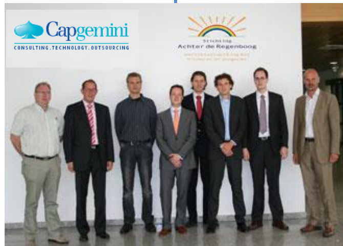
De eerste groep cursisten van Capgemini die procesbeschrijvingen opstelde voor de AdR.

In de vorige nieuwsbrief berichtten wij al dat we hard bezig zijn om het CBF keurmerk voor goede doelen te behalen. Daar is afgelopen maand een nieuwe stap in gezet. Vanaf donderdag 29 mei maken nieuwe medewerkers van Capgemini, die tijdens een introductieprogramma worden opgeleid in Business Analyse, een aantal procesbeschrijvingen voor de AdR. Dit doen ze op basis van een algemene presentatie van de stichting door één van de bestuursleden en vervolgens twee interviews van iemand van de stichting die de betreffende processen goed kent. Bij het schrijven van de procesbeschrijvingen kunnen de deelnemers verder rekenen op nauwlettende begeleiding van de coaches en de kwaliteitsmanager van Capgemini Academy.